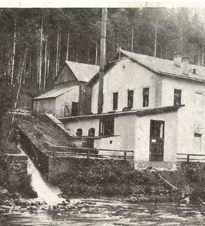
Elektr. Centrale im Kamptal.